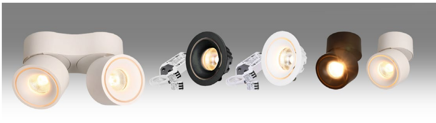
DOUBLE SHINE Art. 162460 E-No 941 300 063