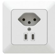
Typ. Nr. 312. USB.13