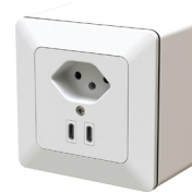
Typ. Nr. 312. USB.13.AP