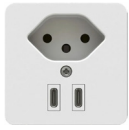
Typ. Nr. 312. USB.13.EF