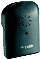
Foto-Gong. Reichweitenverlängerung bei freier Sicht: 50m. mit Eurostecker zum Betrieb an einer Steckdose